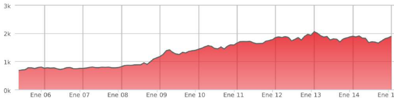
Evolución parados en la Roda. Desde 2006 a 2015